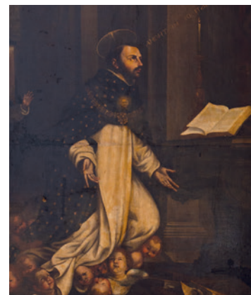
Ignoto, San Tommaso d'Aquino che indica le "cinque vie" e scene della sua vita. Olio su tela, XVIII secolo. Il santo è presentato seduto con un camauro in testa e sul petto il sole e con le mani sembra voglia indicare le famose "cinque vie" per dimostrare l'esistenza di Dio attraverso la natura.