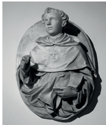
Ignoto, San Domenico di Guzman Medaglione in marmo bianco, XVIII secolo. Il Santo è a mezza figura e ha un libro nella mano sinistra. Bottega napoletana della prima metà del '700.