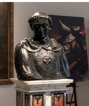
Ignoto, San Tommaso d'Aquino Busto in terracotta, XVIII secolo. Il Santo è a mezza figura. Un tempo era collocato sulla facciata del Santuario insieme a quello di San Domenico di Guzman andato disperso.